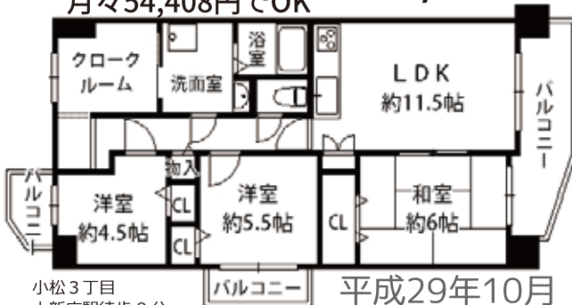
小松 3丁目 上新庄駅徒歩 8分 専有/70.69㎡ 平成29年10月 リフォーム済 バル/12.91㎡・建築/昭和61年3月・管理費等/14,760円・仲介