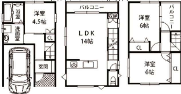
大桐 4丁目・だいどう豊里駅徒歩 13分・土地/44.09㎡・建延/91.12㎡ 構造/木造・外構費、建築確認費別途・仲介