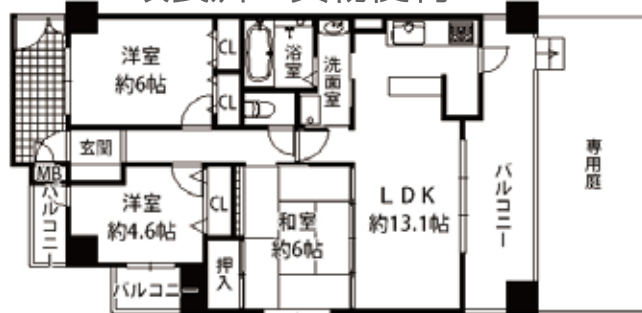
菅原 3丁目・淡路駅徒歩 12分・専有/66.90㎡ バル/16.33㎡・建築/平成16年10月・管理費等/16,320円・仲介