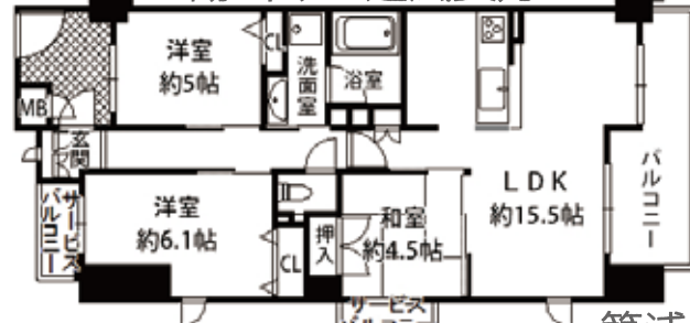
小松 4丁目・瑞光四丁目駅徒歩 5分・専有/70.00㎡ バル/11.84㎡・建築/平成23年2月・管理費等/19,760円・仲介

西淡路 3丁目・東淀川駅徒歩 6分 土地/88.13㎡・建延/110.97㎡ 構造/木造ストレート葺・外構費込・仲介